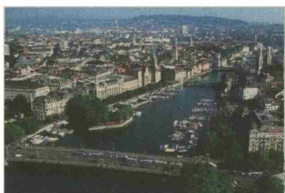
Wirtschaftsraum Zürich: Er ist beliebt bei hochqualifizierten Ausländern.

Hochqualifizierte Laut dem Staatssekretariat für Wirtschaft (Seco) haben 83 Prozent der nach Juni 2002 eingewanderten EU- und EFTA-Bürger eine Berufsbildung oder die Matur. 51 Prozent verfügen über einen Uni-Abschluss oder über eine höhere Berufsbildung. Ihre Zuwanderung hat auf die Löhne