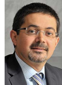
José Marques People & Organisation Email