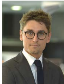
Maxime Dubouloz Deals Email